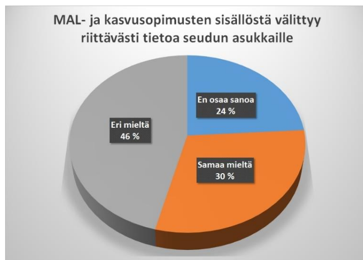
Kuva 45: Vastaajien näkemys kansalaisten mahdollisuudesta seurata MAL-sopimusten sisältöä (n=111).

Toisaalta kansalaisosallistumisen asema on MAL-suunnittelun yhteydessä varsin häilyvä. Vastaajista vain kolmanneksen mielestä MAL- ja kasvusopimusten sisällöstä välittyy riittävästi tietoa seudun asukkaille (kuva 35). Tämä johtaa kahdella tavalla epätydyttävään tilanteeseen: ensinnäkin MAL-prosessien legitimitetti on vähintäänkin rajallinen ja toiseksi MAL-työn tietopohjassa jää hyödyntämättä kansalaisten seudullista elettyä arkea koskeva tietämys.