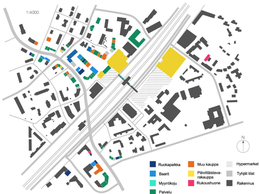
Kuva 32: Etniset palvelut Malmilla.

Myös Malmille on viime vuosina syntynyt suuri määrä etnisten ryhmien ylläpitämiä palveluita (kuva 32).