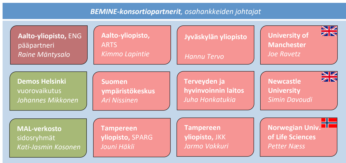
Kuva 1: Tutkimuskonsortio

BEMINE-konsortio on ollut verrattain laaja tutkimuksellinen yhteenliittymä suomalaisessa kontekstissa. Konsortio on koostunut 12 partneriorganisaatiosta, joista kymmenen on ollut tutkimuspartnereita – kahdeksan tutkimusryhmää kuudesta eri yliopistosta, sekä kaksi tutkimuslaitosta – ja kaksi vuorovaikutukseen keskittyneitä partnereita. Kolme partneria on tullut mukaan Suomen ulkopuolelta: kaksi Iso-Britanniasta ja yksi Norjasta. Hankkeen tukena on ollut alusta lähtien aktiivinen joukko sidosryhmiä julkishallinnon eri tasoilta. Lisäksi hankkeen kansainvälinen referenssiryhmä on tuonut omat kriittiset, kannustavat ja rakentavat havaintonsa tutkijoiden työskentelyä tukemaan.